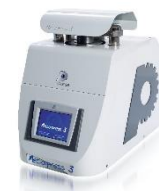
REF. 53500 MECAPRESS 3