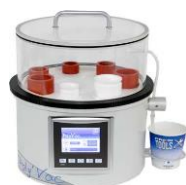
REF. 53600 Poly'vac