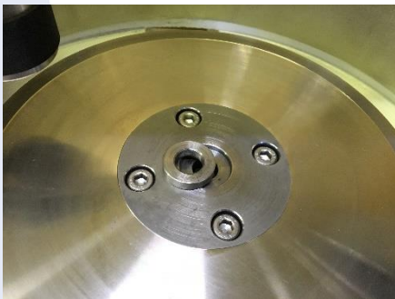
定盤位置決めリング